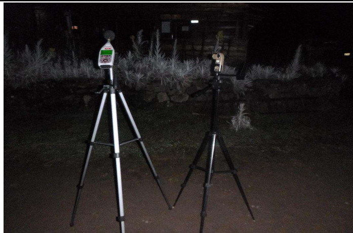
Entorno punto de muestreo y posibles PCA