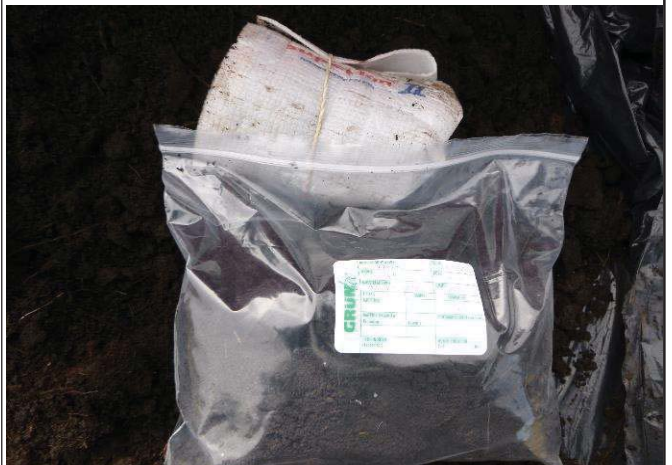
Fotografía 6. Etiquetado de la muestra y llenado de envases