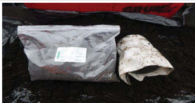
Fotografía 6. Etiquetado de la muestra y llenado de envases