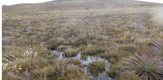
Fotografía 1. Área de toma de muestra