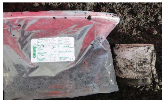
Fotografía 6. Etiquetado de la muestra y llenado de envases