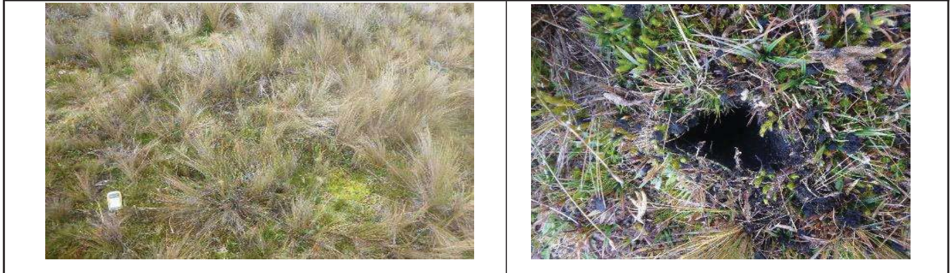
Fotografía 1. Área de toma de muestra