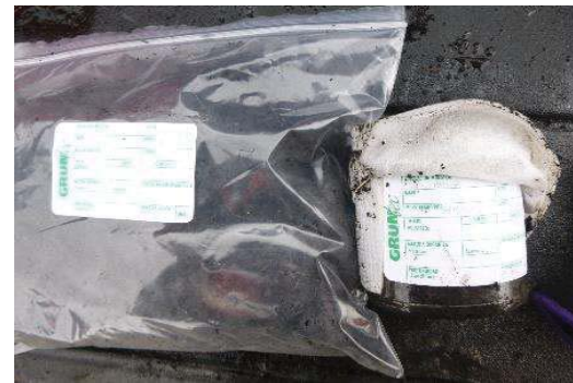
Fotografía 6. Etiquetado de la muestra y llenado de envases