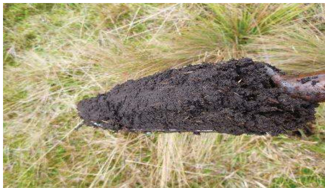
Fotografía 3. Apariencia de las submuestras