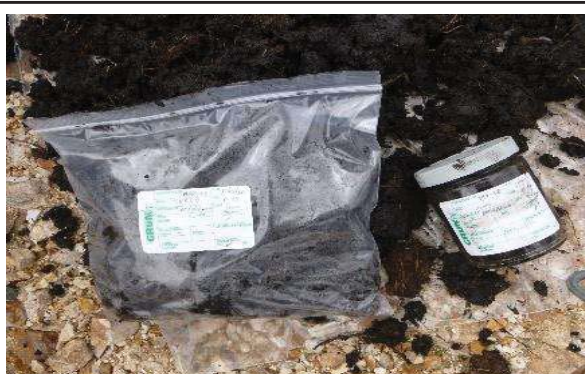
Fotografía 6. Etiquetado de la muestra y llenado de envases