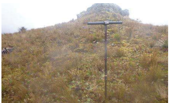
Fotografía 4. Toma de submuestras