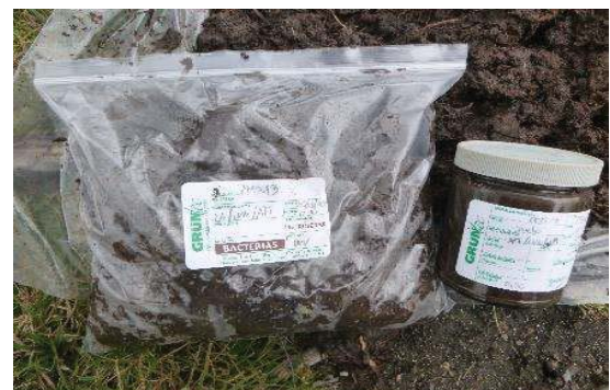
Fotografía 6. Etiquetado de la muestra y llenado de envases