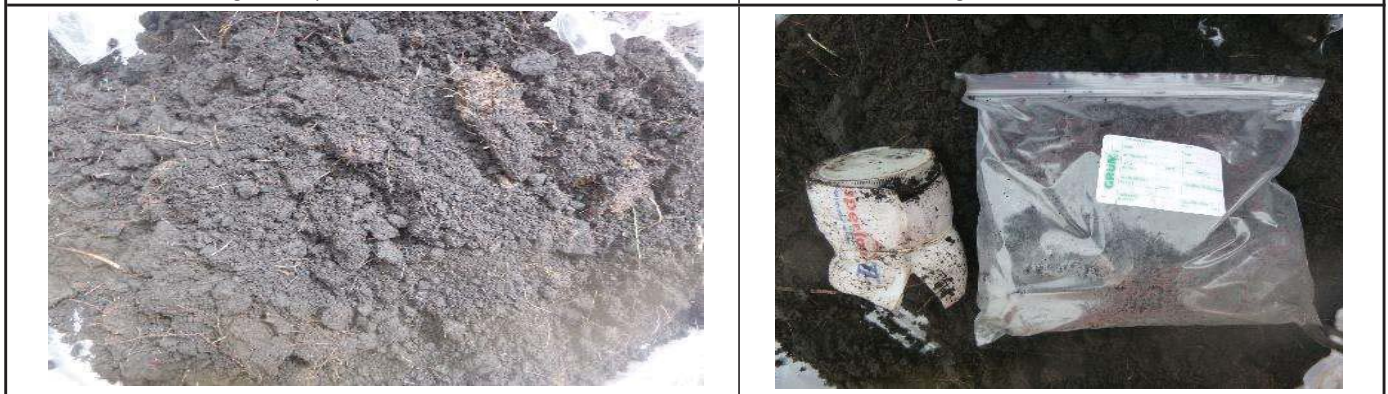
Fotografía 5. Colección de la muestra y homogenización