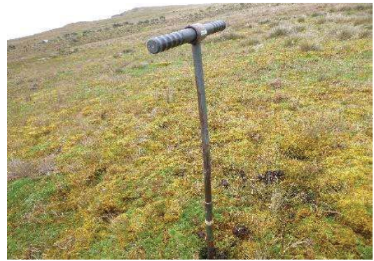
Fotografía 4. Toma de submuestras