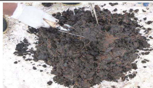
Fotografía 5. Colección de la muestra y homogenización