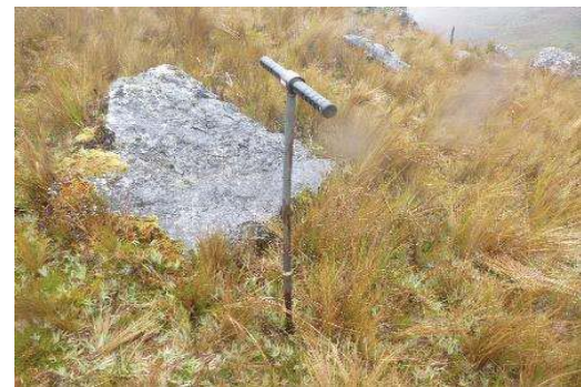
Fotografía 4. Toma de submuestras