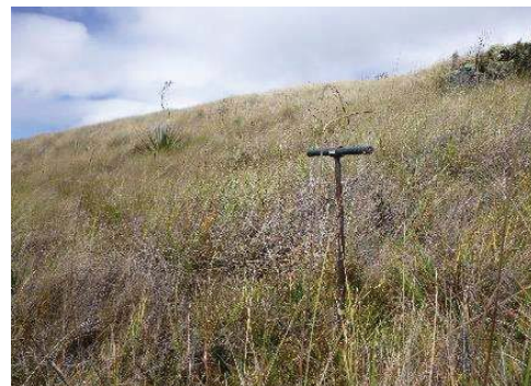
Fotografía 4. Toma de submuestras