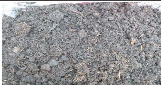
Fotografía 5. Colección de la muestra y homogenización