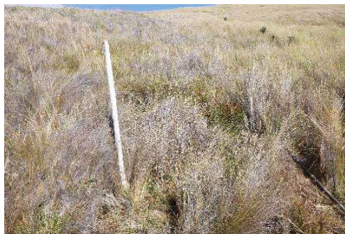
Fotografía 1. Área de toma de muestra