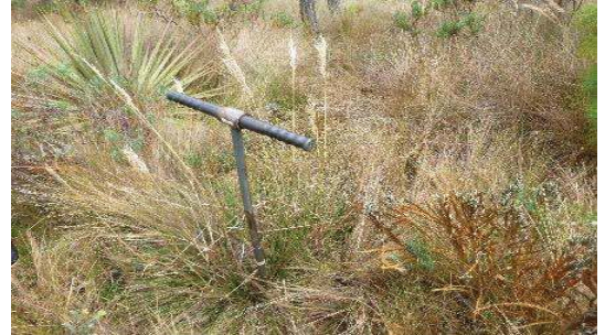
Fotografía 4. Toma de submuestras