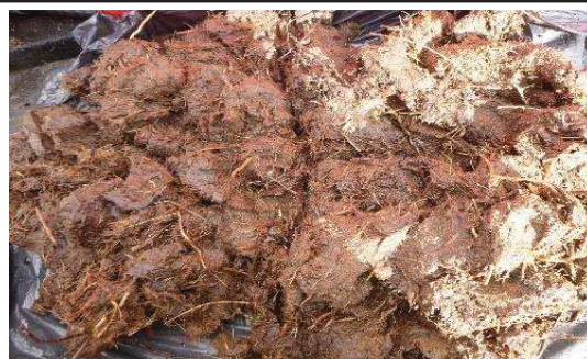
Fotografía 5. Colección de la muestra y homogenización