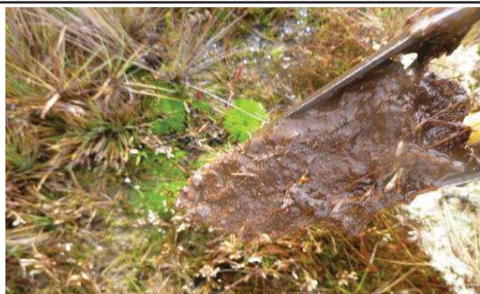
Fotografía 3. Apariencia de las submuestras