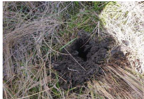
Fotografía 2. Punto de muestreo de submuestras