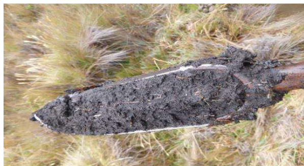
Fotografía 3. Apariencia de las submuestras