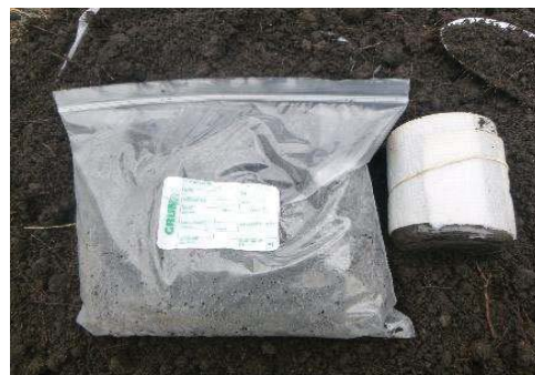
Fotografía 6. Etiquetado de la muestra y llenado de envases