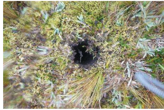
Fotografía 2. Punto de muestreo de submuestras