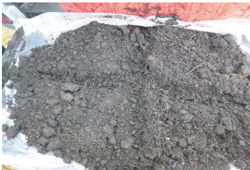
Fotografía 5. Colección de la muestra y homogenización