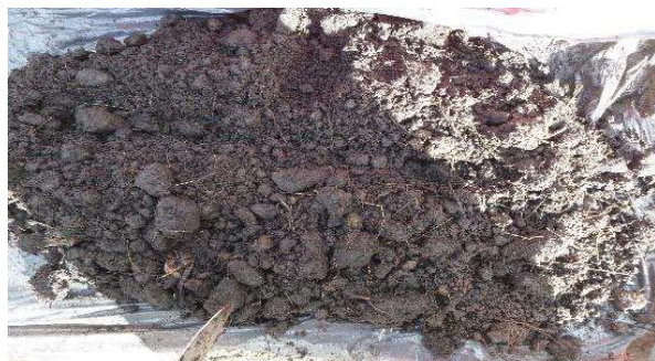
Fotografía 5. Colección de la muestra y homogenización