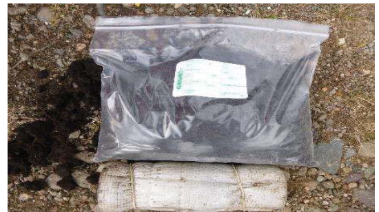
Fotografía 6. Etiquetado de la muestra y llenado de envases