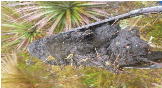
Fotografía 3. Apariencia de las submuestras