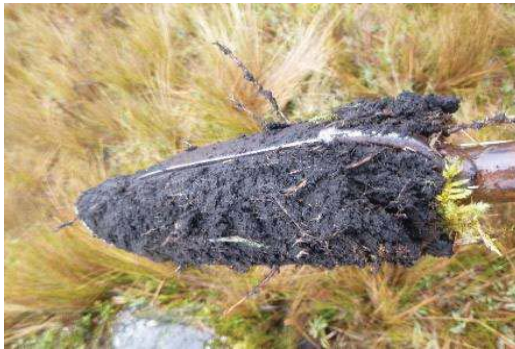
Fotografía 3. Apariencia de las submuestras