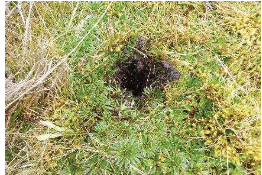
Fotografía 2. Punto de muestreo de submuestras