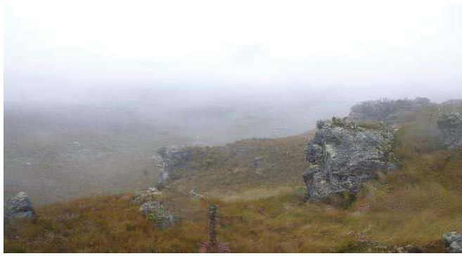
Fotografía 1. Área de toma de muestra