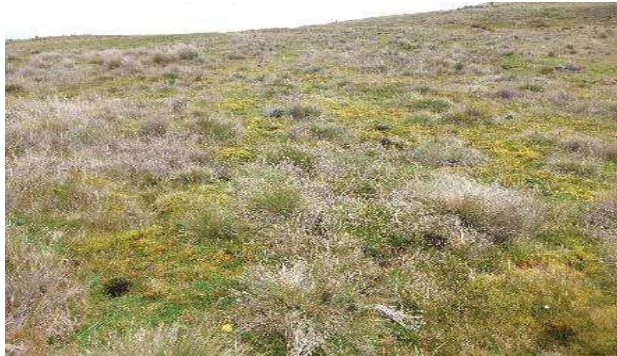
Fotografía 1. Área de toma de muestra