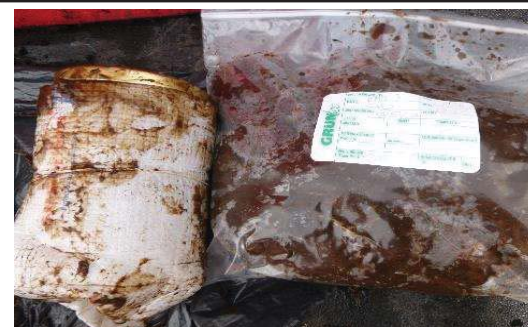
Fotografía 6. Etiquetado de la muestra y llenado de envases