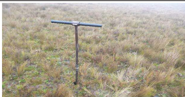
Fotografía 4. Toma de submuestras