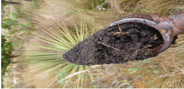
Fotografía 3. Apariencia de las submuestras