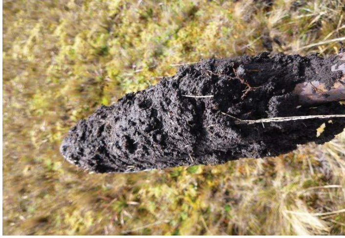
Fotografía 3. Apariencia de las submuestras