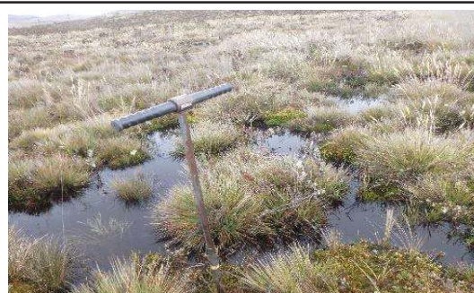
Fotografía 4. Toma de submuestras