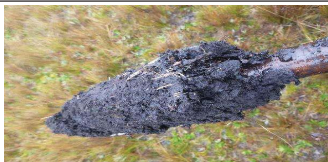
Fotografía 3. Apariencia de las submuestras