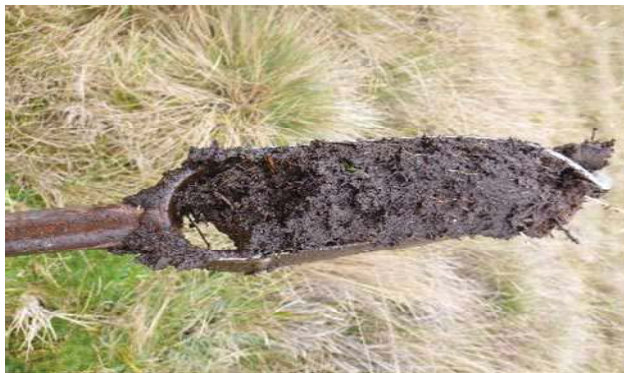
Fotografía 3. Apariencia de las submuestras