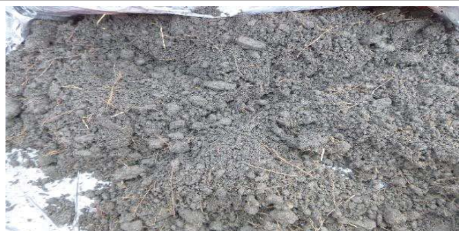
Fotografía 5. Colección de la muestra y homogenización