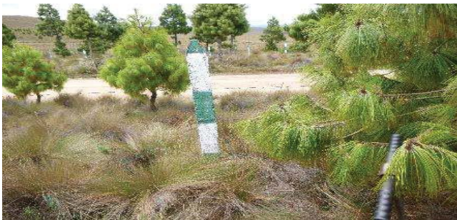
Fotografía 1. Área de toma de muestra