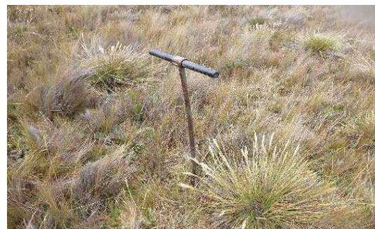
Fotografía 4. Toma de submuestras