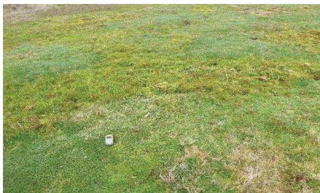
Fotografía 1. Área de toma de muestra