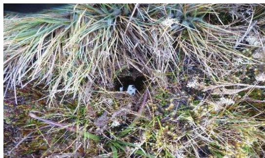
Fotografía 2. Punto de muestreo de submuestras