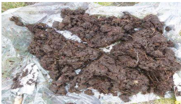
Fotografía 5. Colección de la muestra y homogenización