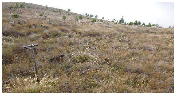
Fotografía 1. Área de toma de muestra