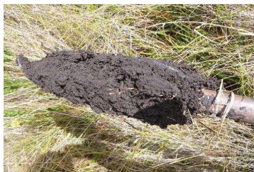
Fotografía 3. Apariencia de las submuestras