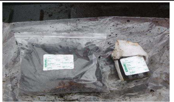
Fotografía 6. Etiquetado de la muestra y llenado de envases