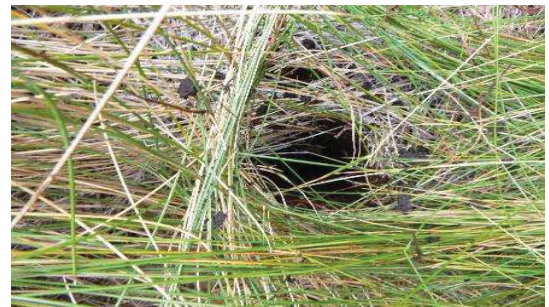
Fotografía 2. Punto de muestreo de submuestras