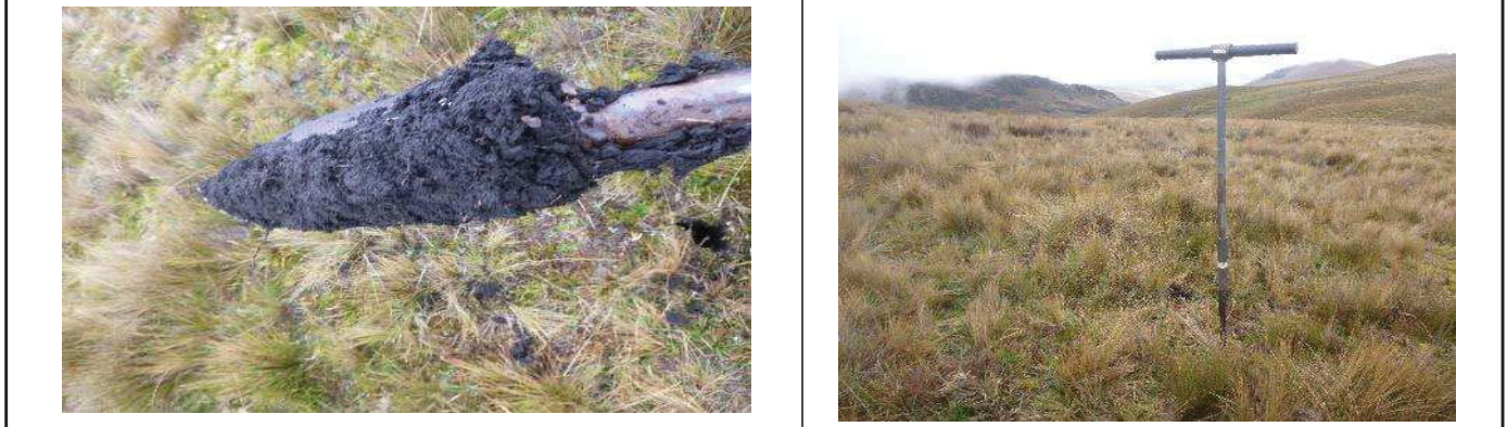
Fotografía 3. Apariencia de las submuestras