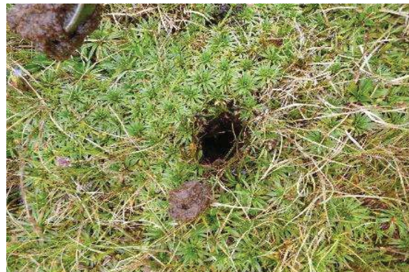
Fotografía 2. Punto de muestreo de submuestras