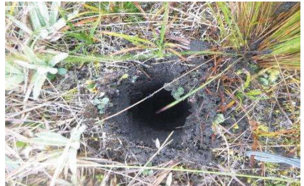
Fotografía 2. Punto de muestreo de submuestras