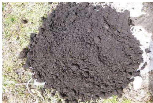
Fotografía 5. Colección de la muestra y homogenización