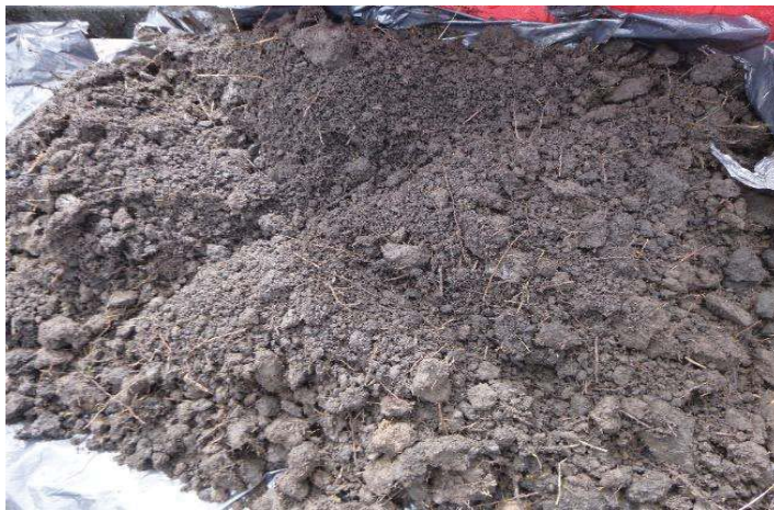
Fotografía 5. Colección de la muestra y homogenización