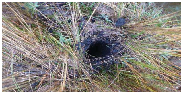
Fotografía 2. Punto de muestreo de submuestras