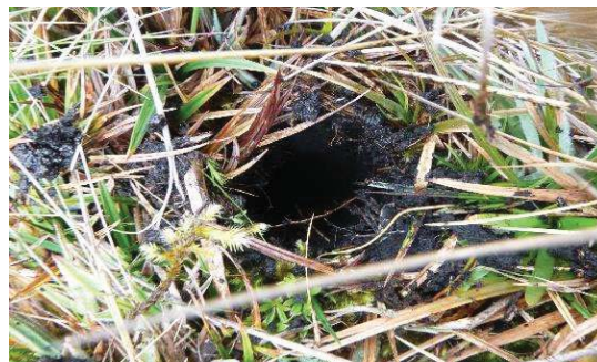
Fotografía 2. Punto de muestreo de submuestras