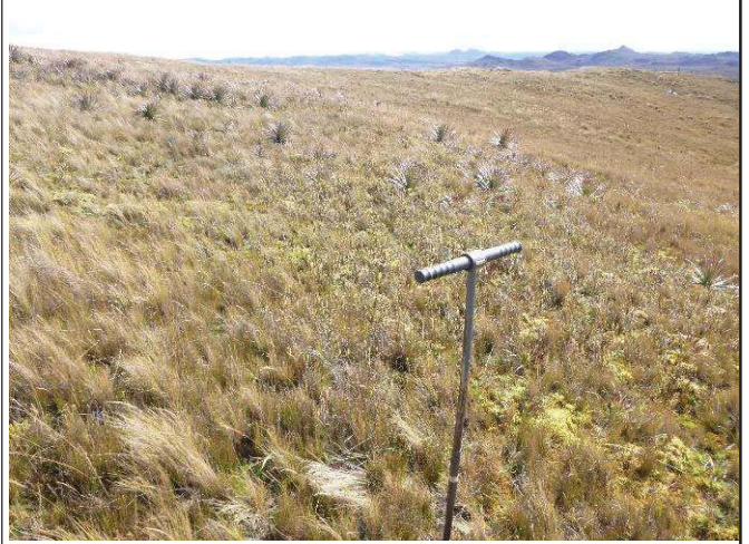
Fotografía 4. Toma de submuestras