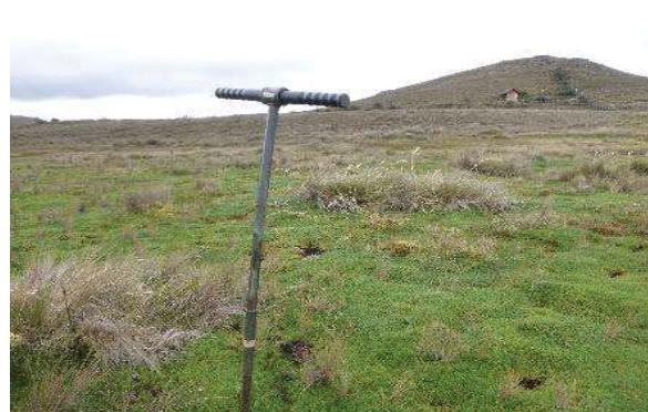
Fotografía 4. Toma de submuestras