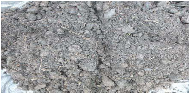
Fotografía 5. Colección de la muestra y homogenización